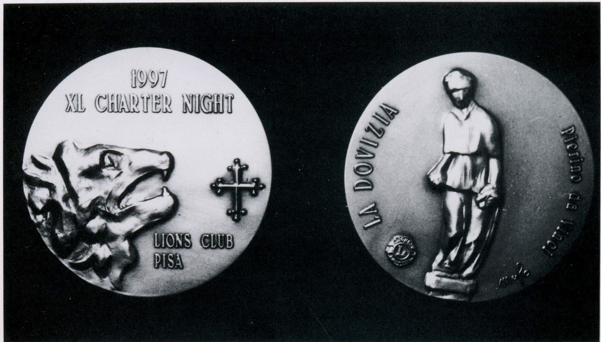
1997 - Vittorio Merlo realizza la medaglia per il XL anniversario della Charter Night.